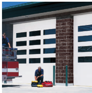
Serie TC, TC300

Además, Raynor ofrece una línea completa de puertas seccionales, corredizas, de incendio, de alto rendimiento y de tráfico, así como rejas de seguridad. Consulte a su representante Raynor o visite www.raynor.com si desea conocer más.