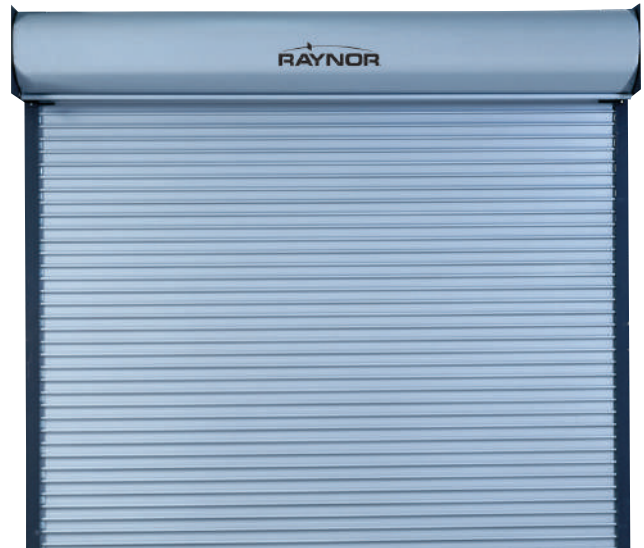
Listón plano DuraCoil (FF)